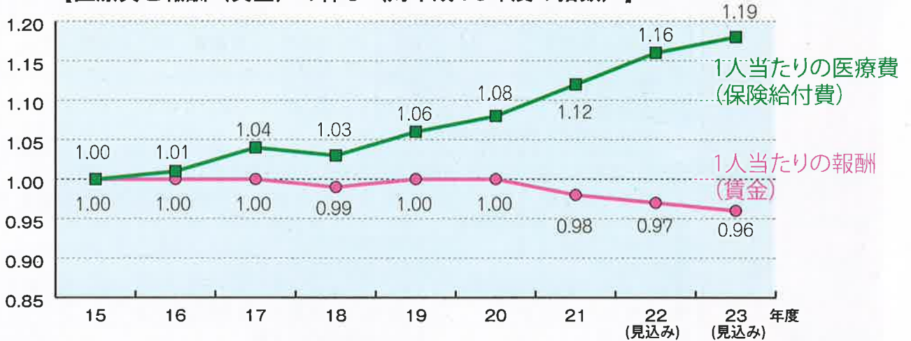
【医療費と報酬（賃金）の伸び（対平成15年度の指数）】

平成18年度に5,000億円あった準備金は、21年度末には▲3,200億円の赤字に陥りました。22年度から24年度末までの間に返済しなければなりません。